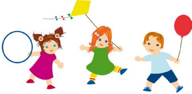
SPGV-FL Spielgruppenverein Fürstentum Liechtenstein

« Spielgruppen ermöglichen Kleinkindern wichtige soziale Erfahrungen in einer überschaubaren Gruppe an vertrautem Ort. Der Spielgruppenverein setzt sich für die gesellschaftliche Anerkennung und Wertschätzung der Spielgruppen ein und will Qualität und Entwicklung der Spielgruppentätigkeit voranbringen und den interdisziplinären Austausch fördern. »